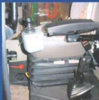
Joystick-styring leveres i mange forskellige udførelser, her til totalstyring af gummiged.