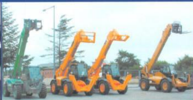
Montering af fjernbetjening på alle mærker