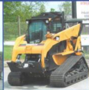
Radlostyring af minimaskiner